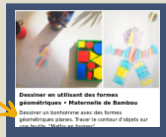
Dessiner en utilisant des formes géométriques • Maternelle de Bambou Dessiner un bonhomme avec des formes géométriques planes. Tracer le contour d'objets sur une feuille "Matru en formes"

https://maternelle-bambou.fr/dessiner-avec-formes-geometriques/